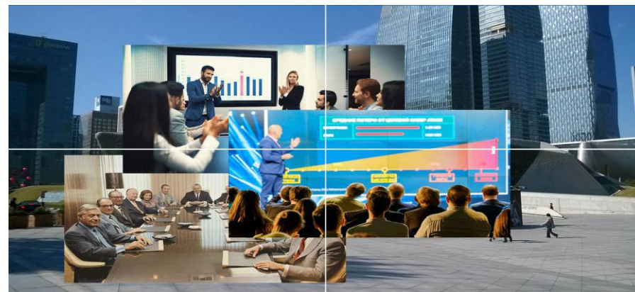
场景四：2*2 拼接成一个主屏幕 4 图层任意