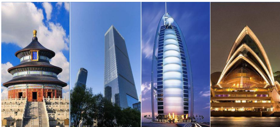
场景一：4 窗口拼接独立显示