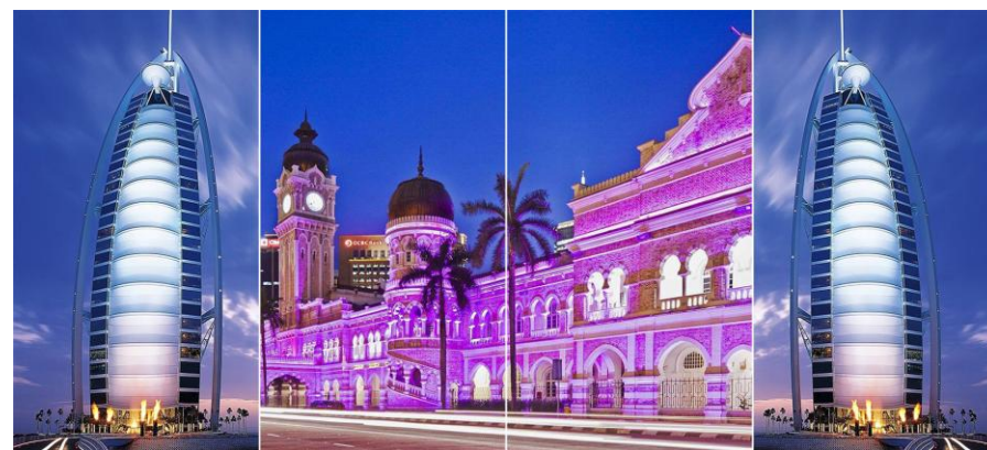
场景二：输出 2&3 拼接成一个主屏幕 侧屏幕采用镜像功能